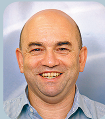
יוני מוכל" חברת BYON

פתרון BCM הוא סוג של תעודת ביטוח. אתם יודעים כמה שווה הפוליסה רק כאשר אתם נזקקים להתאוששות מהירה מאסון שהלם בכס כרעם ביום בהיר. זה לא הזמן להתחרט על שטחיות בתהליך בחירת הספק, שבוצעה בימים עברו, כאשר כל הנושא נראה מנותק מהפעילות העסקית השגרתית. לכן חשוב כל כך לבסס את הבחירה על מוטיבין בכלל ועל הוכחות בשטח בפרט, שיעידו כי הספק הנבחר מנוסה בפרויקטי BCM בישראל בכלל ובמגזרים הרגישים במיוחד.